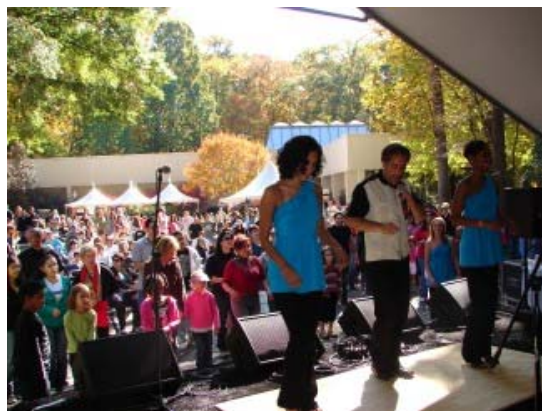
La escuela “SalsAtlanta” dando clases de baile a los asistentes.