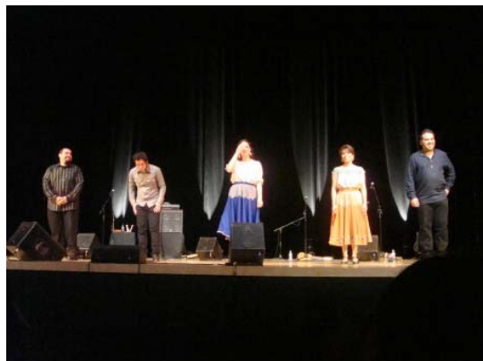
Presentación de “Los Cenzontles” en el Centro de Artes Rialto.

El 5 de noviembre de 5:00pm a 8:00pm concluye la serie de eventos en el Centro de Artes Rialto con una plática sobre la tradición del día de muertos así como un taller para decorar calaveritas. El evento es gratuito y abierto al público en general.