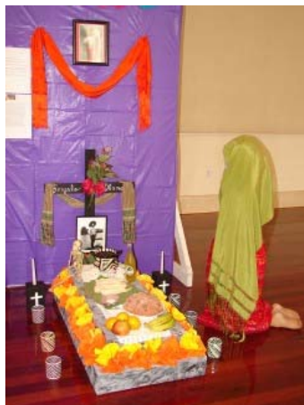
Dos de los altares en exhibición.