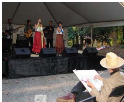
Dibujando mientras escucha a “Los Cenzontles”