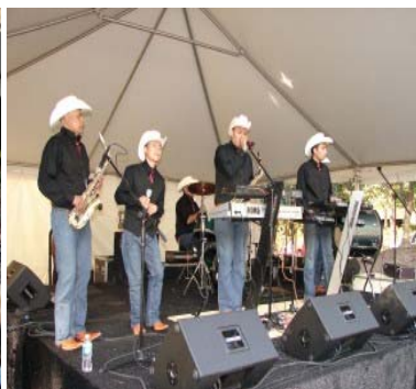
Presentación del grupo “Arrieros musical