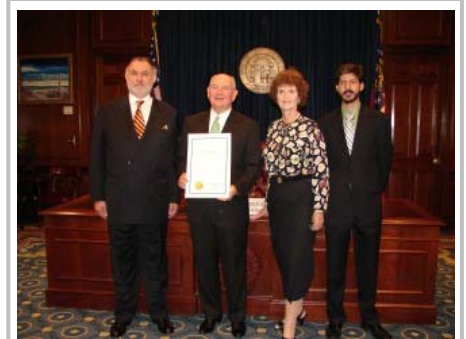
Izq a derecha: Cónsul General Salvador De Lara, Gobernador Sonny Perdue, Laura Hagel y Cónsul Raúl Saavedra.

El miércoles 7 de octubre el Gobernador del Estado de Georgia, Sonny Perdue, realizó la entrega protocolaria de la proclama con motivo de la Independencia de México, documento en el que reconoce la invaluable contribución de la cultura mexicana a este Estado y al país.